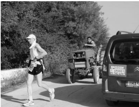
Wer jagt hier wen? Südlich von Korinth zw. den Weinfeldern.

Sonst hätte ich mir wohl doch etwas Sorgen gemacht, denn auf dem mit Steinen übersäten Felsen rutschte ich mehrfach. Zum Glück überholte mich gleich am Einstieg ein Spanier, der eine echte Bergziege war und blind den Weg kannte – ich hab mich an ihn “geklammert“ und habe genau seinen Weg genommen. Endlich oben kam der angekündigte Wind – ich ging also bergab – zusammen mit einem Japaner (der nur noch 3 Läufe im Jahr macht: Ultras größer 200km), den ich bremsen konnte, damit er nicht stürzte.